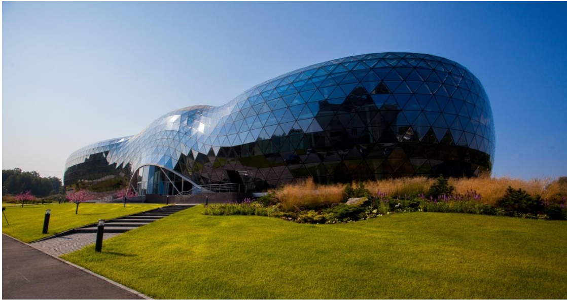
Центр коллективного пользования