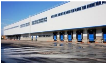
ПЛП – 2,5 МЛРД РУБ.