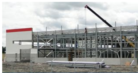
МОНДЭЛИС – 3,5 МЛРД РУБ.