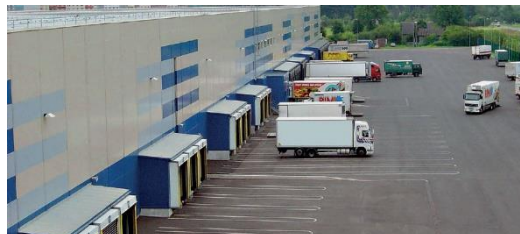
СКЛАДКОМПЛЕКС – 0,3 МЛРД РУБ.