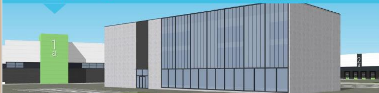
Модель производственных площадей