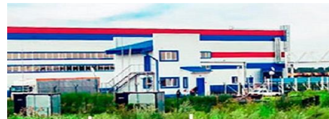
ЗТИ СИБИРЬ – 0,9 МЛРД РУБ.