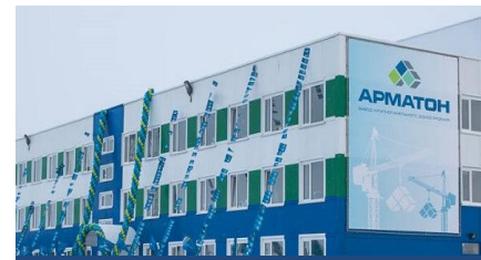
АРМАТОН– 1,6 МЛРД РУБ.