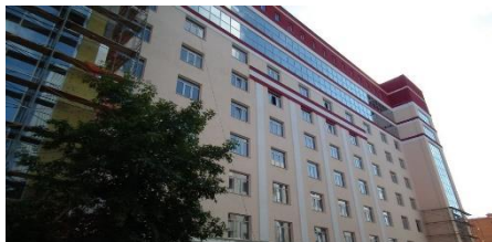
МЕДТЕХНОПАРК – 1,6 МЛРД РУБ.