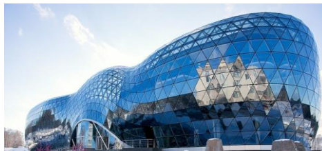
БИОТЕХНОПАРК – 1 МЛРД РУБ.