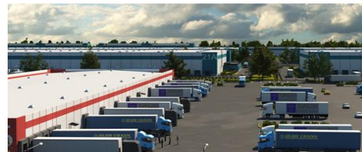
ВОСТОЧНЫЙ ПЛП– 0,9 МЛРД РУБ.