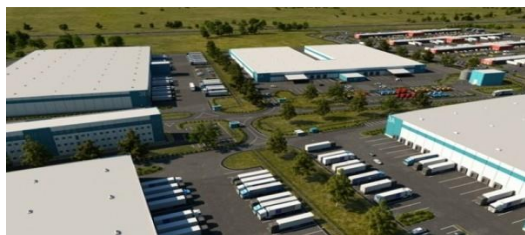
РУСАГРОМАРКЕТ – 6,9 МЛРД РУБ.