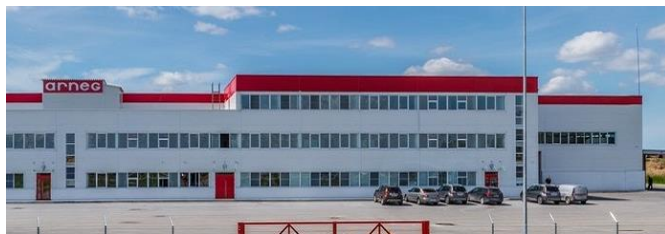
АРНЕГ – 0,7 МЛРД РУБ.