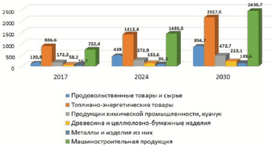
Рис. 3. Динамика экспорта Новосибирской области по основным товарным группам (млн. долларов США)

Результатом реализации стратегии по развитию межрегиональных и внешнеэкономических связей, наращиванию экспорта товаров и услуг будет являться достижение следующих значений показателей по инновационному сценарию к 2030 году: