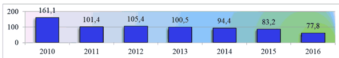
Рис. 3.2. Объем работ, выполненных по виду деятельности "Строительство" в Новосибирской области за 2010 - 2016 гг., в % к предыдущему году в сопоставимых ценах

В общем объеме работ, выполненных по виду деятельности "Строительство", наибольший удельный вес занимает строительство жилья (более 70%).