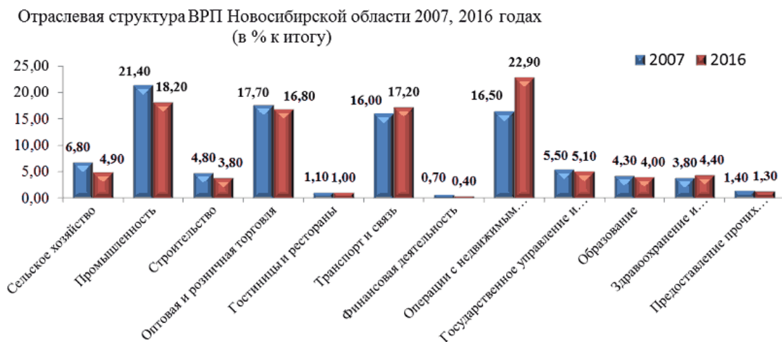
Рис. 1. Сравнительная характеристика отраслевой структуры валового регионального продукта Новосибирской области, сложившейся в 2007 и 2016 годах

В США по итогам 2013 года доля сферы услуг (кроме транспорта и торговли) в ВВП составляет 56,2%, в городе Москве указанный показатель (в структуре ВРП) составляет 41,2%, а в Новосибирской области место сферы услуг в экономике только приближается к указанным значениям - 38,1%.