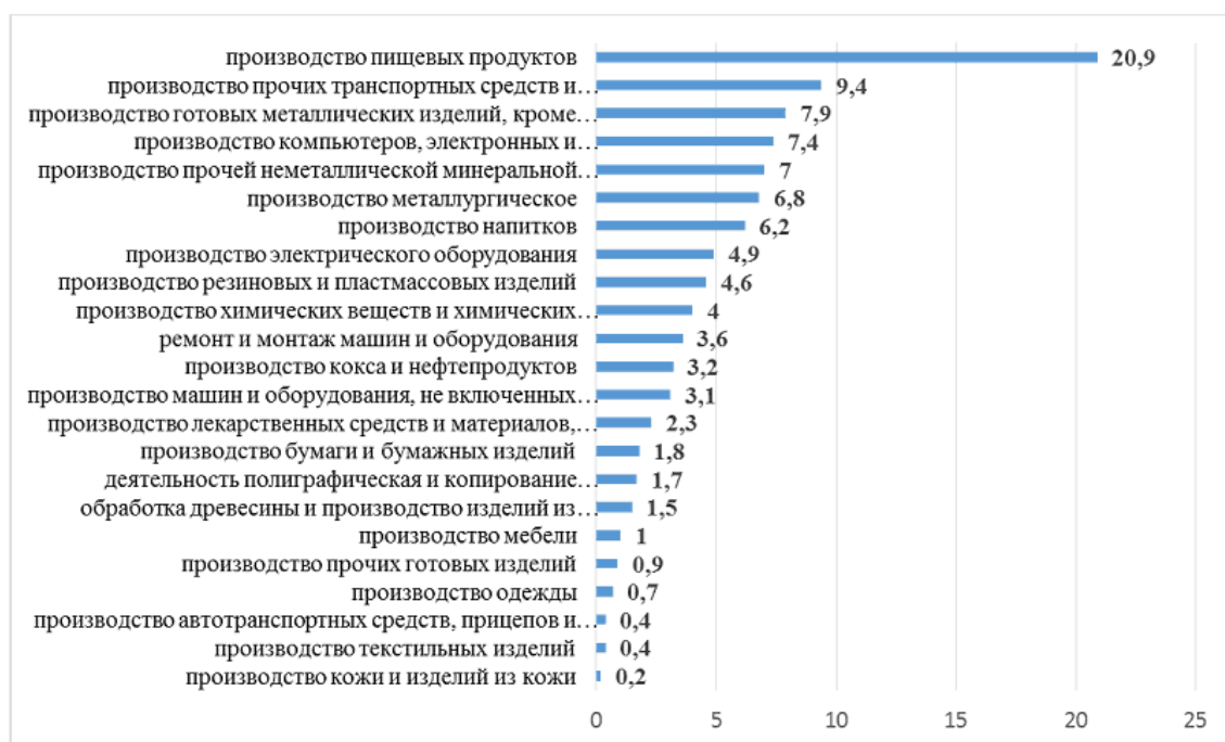
Рис. 2. Структура объема отгруженных товаров собственного производства, выполненных работ и услуг собственными силами организациями обрабатывающих производств по видам экономической деятельности в 2017 году, в %

Ключевыми отраслями развития определены высокотехнологичные отрасли промышленности с учетом наличия рыночных возможностей (достаточно высокой емкостью рынка в РФ, прогнозный темп роста рынка, экспортный потенциал) и условий для развития сектора (сырье и природные условия, человеческие ресурсы, финансирование, поставщики и партнеры) (далее - приоритетные виды деятельности промышленного производства):